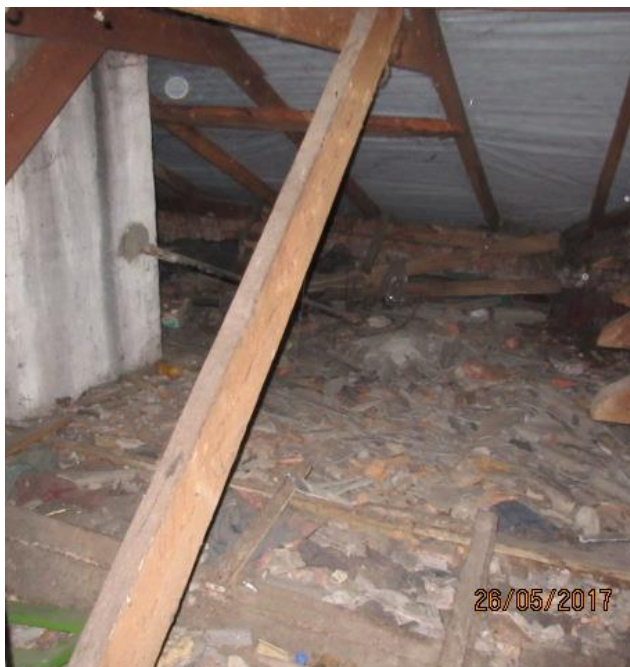
Jumta spāru gali